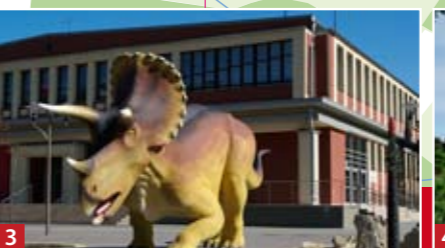
3 Dom Kultury.