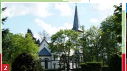
2 Neoklasycystyczny kościół Ewangelicko Augsburski projektu K. F. Schinkla z 1821 roku.